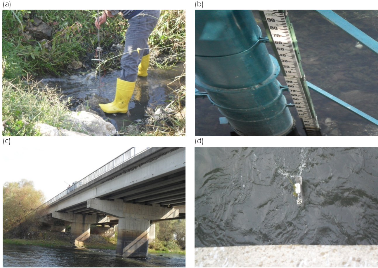
Şekil 3. (a) Akçalar Deresi Debi Ölçümü, (b) Göl Su Kotu, (c) Kocasu Çayı'nda Debi Ölçümü (Uluabat Köprüsü Üzerinden), (d) Köprüden Sarkıtılan Muline